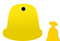
METALE I TWORZYWA SZTUCZNE