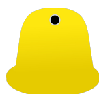
Metale i tworzywa sztuczne

Odbiór odpadów z podziałem na 5 poniższych frakcji: